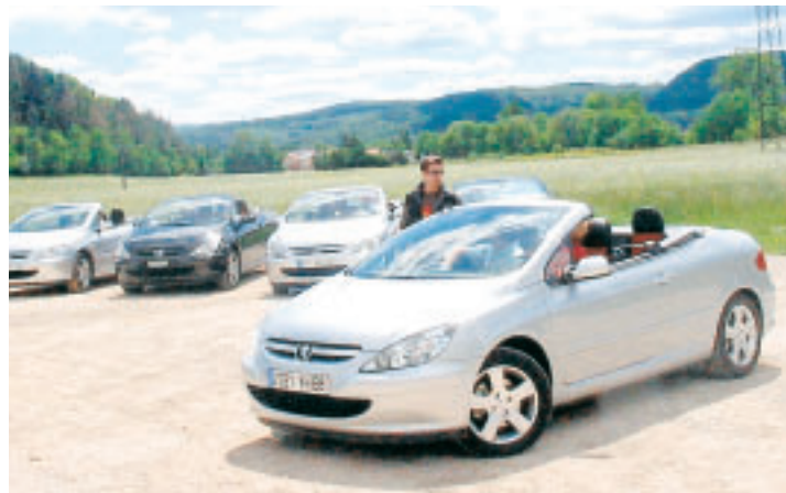
Le dernier coupé-cabriolet de la firme du Lion suscite des passions.